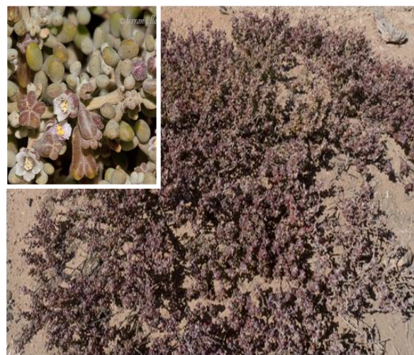
القرملم Zygophyllum gaetulum Emb.