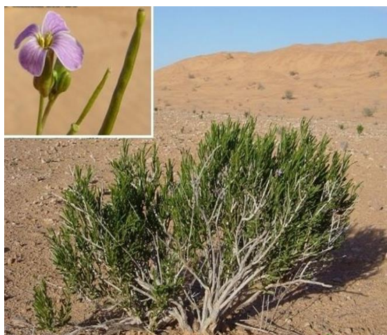
شكل ( 2 ) نبات زويتينا Oudneya africana R.Br